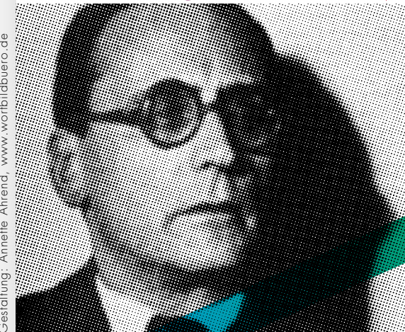
Gestaltung: Annette Ahrend, www.wortbildbuero.de

24. bis 26. 11. 2011 Musikwissenschaftliches Institut, Basel